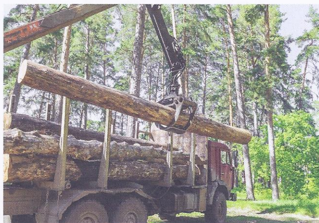
Spravilo lesa do kupca z vlakom in s tovornjakom.