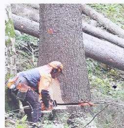
Da drevo pade, na nasprotni strani zaseka podžaga drevo.

Sečnja drevesa se opravlja z motorno žago ali s stroji za podiranje drevja. To opravilo je zelo nevarno. Opravljajo ga profesionalni sekači, ki morajo dobro načrtovati, kam bo deblo padlo. Posekanemu drevesu odstranijo veje in zgornji del krošnje, da ostane samo deblo. Deblo razžagajo na dogovorjene dolžine.