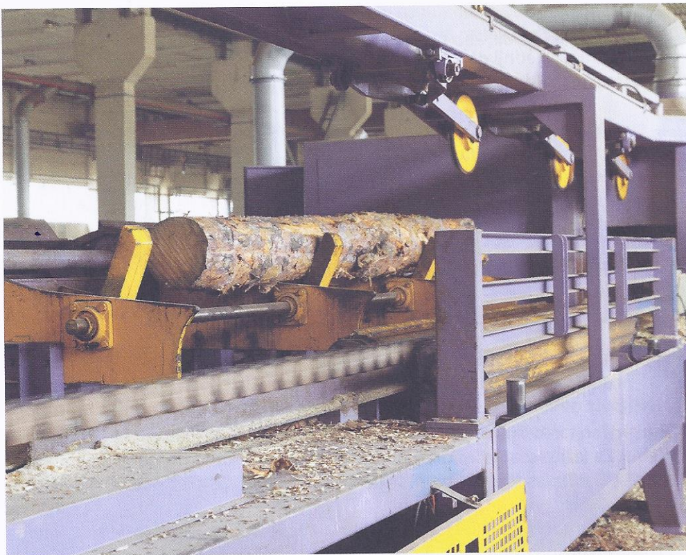
• Žaganje hlodovine

Hlodovina je okrogel les, ki se uporablja za proizvodnjo žaganega lesa in za proizvodnjo furnirja. Les za celulozo in plošče se uporablja za proizvodnjo celuloze, ivernih in vlaknenih plošč. Drug okrogel industrijski ali tehnični les se uporablja predvsem za drogove, pilote, stebre, ograje, jamske opornike, vžigalice, lesno galanterijo, destilacijo ter pridobivanje tanina (spojine grenkega okusa, ki se uporablja pri strojenju usnja in v zdravstvu, najdemo pa ga tudi v hrani in pijači). Les za kurjavo je les iz debla in vej, ki se uporablja kot kurivo.