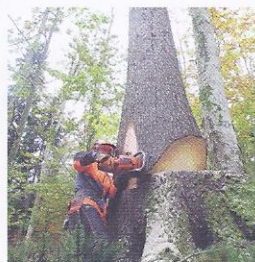
Sekač najprej z motorno žago naredi klinasti zasek.